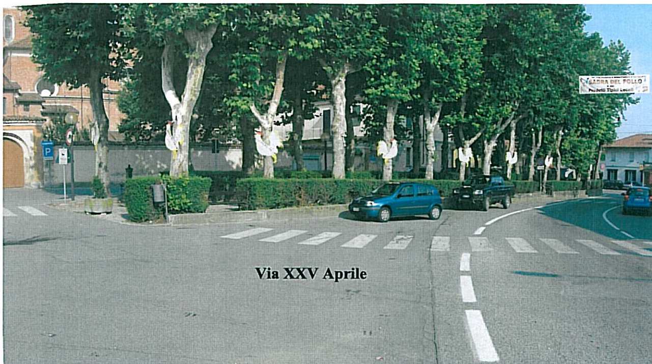
SIMULAZIONE RIVESTIMENTO VIA XXV APRILE