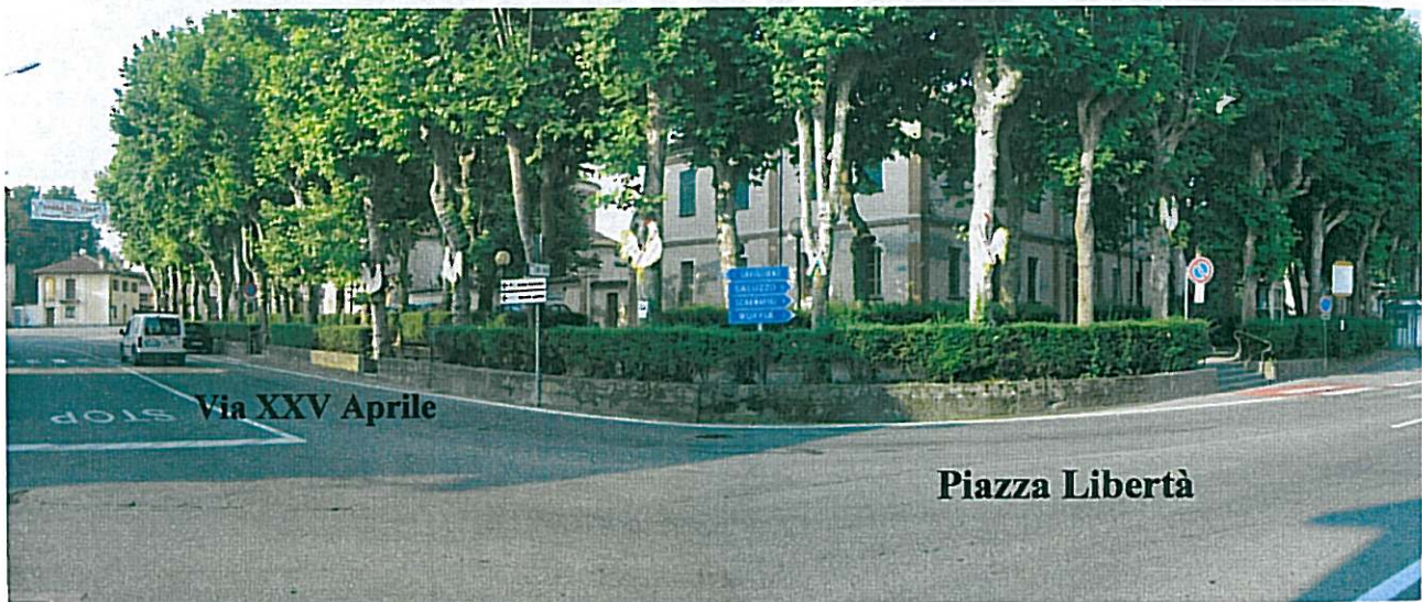
MURO CONTENIMENTO GIARDINI PIAZZA LIBERTÀ